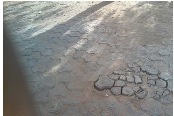
Pavage de la cour du gouvernorat