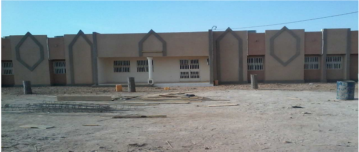
Etat de l'ouvrage à la finition

Sous la conduite du Directeur Régionale de l'Urbanisme et du Logement, nous avons visité le chantier de réhabilitation du gouvernorat. Les ouvrages photographiés se présentent comme suit :