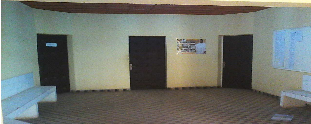
Peinture sur mur intérieur