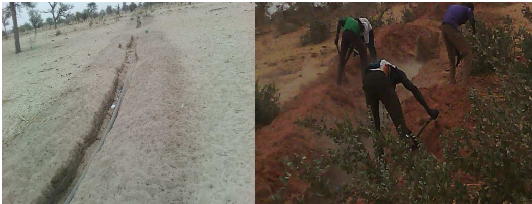
Mauvaise pose de la conduite Enterrement de la conduite en cours