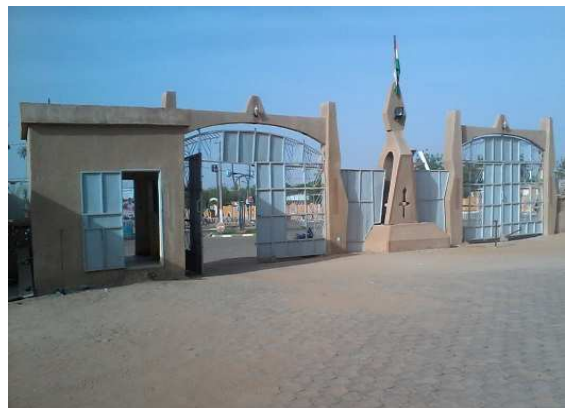
travaux de construction du portail