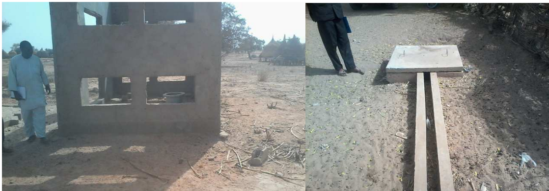
L'abri groupe le regard de BF bornes fontaines