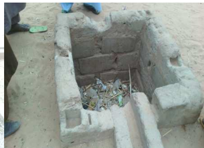
Intérieur du BF non équipé Regard de borne fontaine