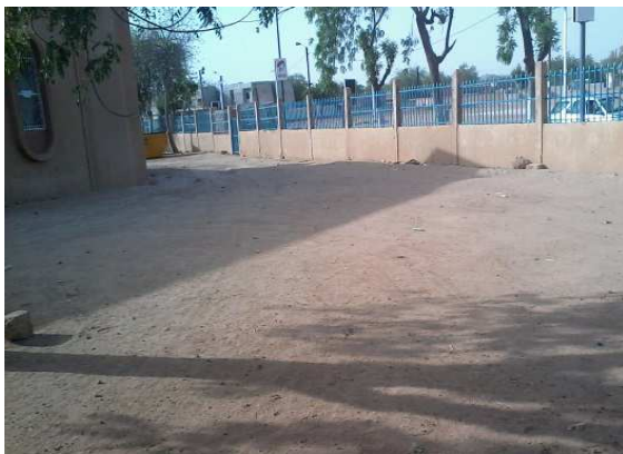
Remblai de la cour