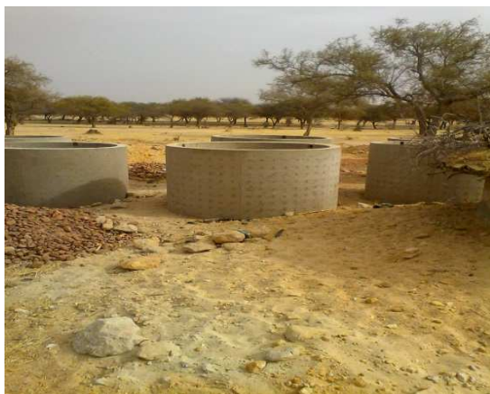
Buses pour les puits talba Ibrahim