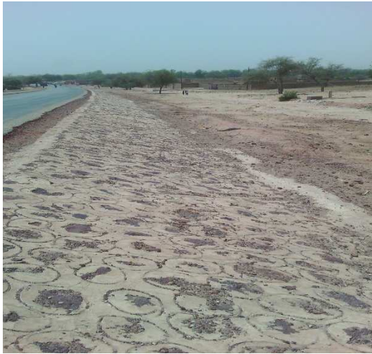
Perrés maçonnés route RN1