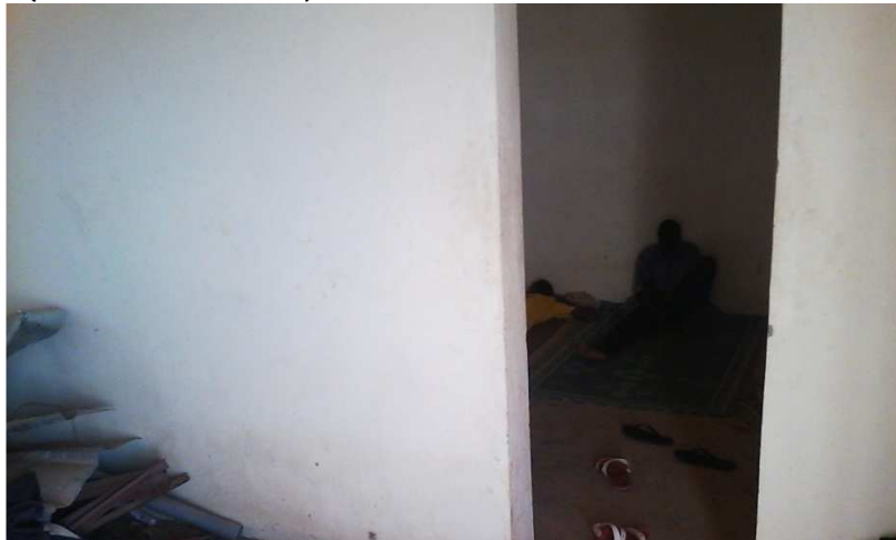
Intérieur de la pièce (case gardien)