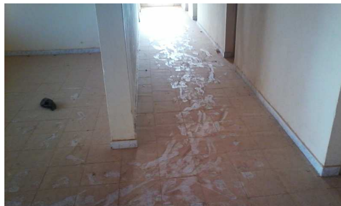
Interieur de l'ouvrage(probleme de menuiseries)