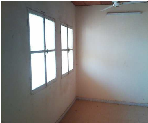
Interieur de l'ouvrage