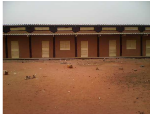
Salles de classes (école banizoum)