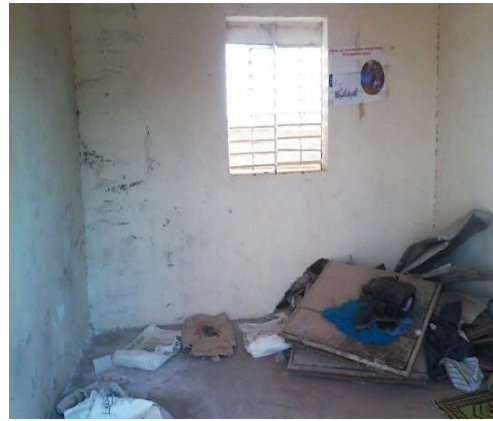
intérieur case gardien