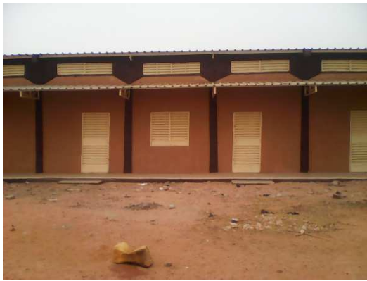
Salles de classes (école Rouga peulh)