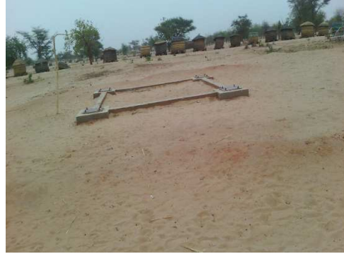
Réservoir (100m 3 ) posé au sol sur la fondation du château