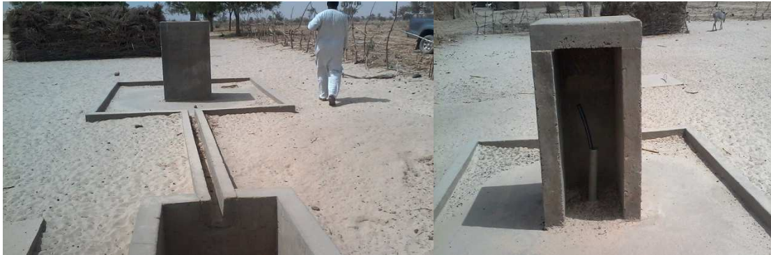
L'état des bornes fontaines

Voici l'état de chantier photographié ainsi qui suit :