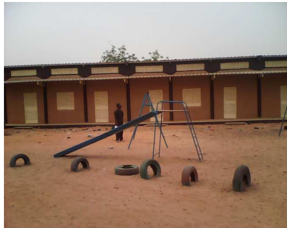
Salles de classes (jardin d'enfant)