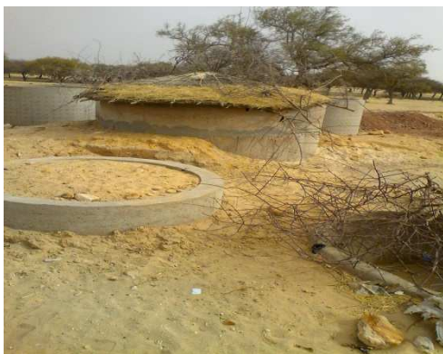
Puits talba Ibrahim