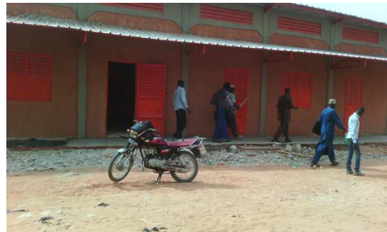
La Façade principale de deux blocs des salles des classes BAGALAM