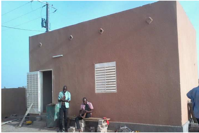
Case gardien (avenant du marché)