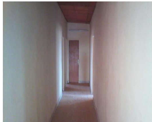
Interieur de l'ouvrage