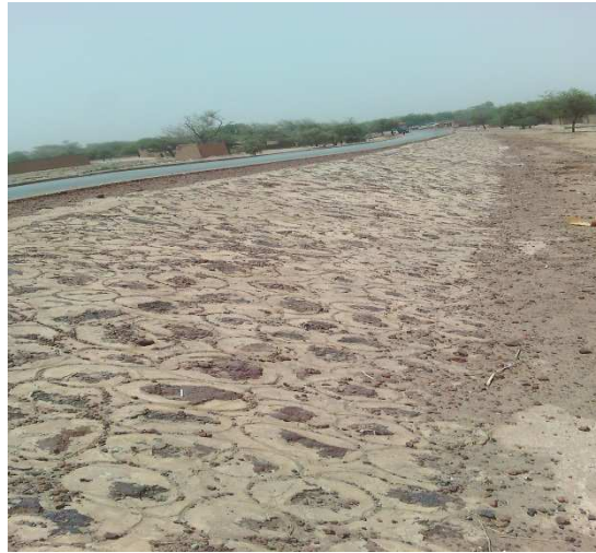
Perrés maçonnés route RN1