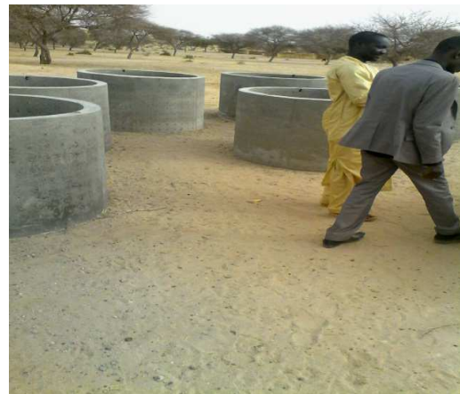
Buses pour le puits