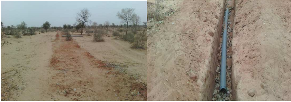
Partie de Conduite enterrée Pose de la conduite