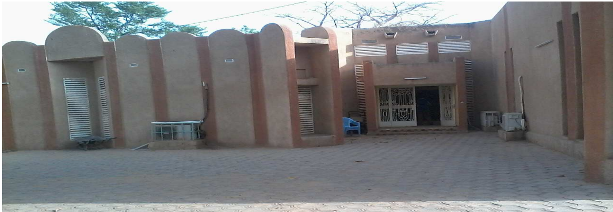
Le bâtiment principal réhabilitation

Sous la conduite du Directeur Régionale de l'Urbanisme et du Logement, nous avons visité le chantier de réhabilitation du gouvernorat. Les ouvrages photographiés se présentent comme suit :