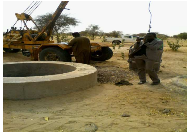
Puits village AZAGOR