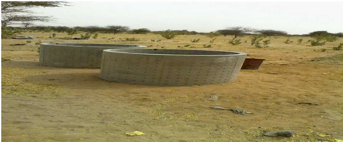
Buses pour la mise en eau