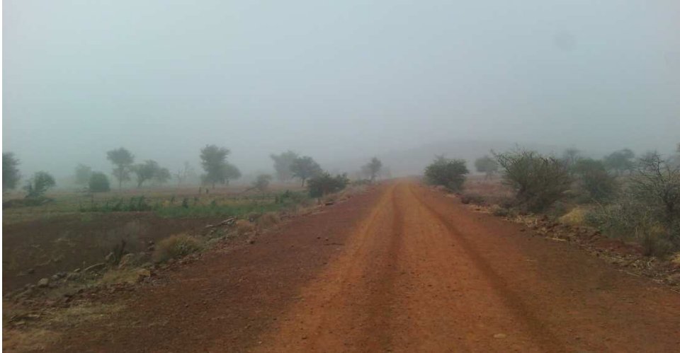
Seuil de zangon Roukouzoum (compactage latéritique de la digue)

La photographie du chantier se présente comme suit :