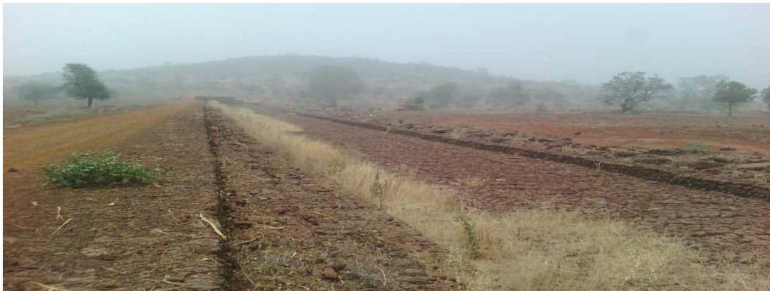
Seuil de zangon Roukouzoum (gabionnages)