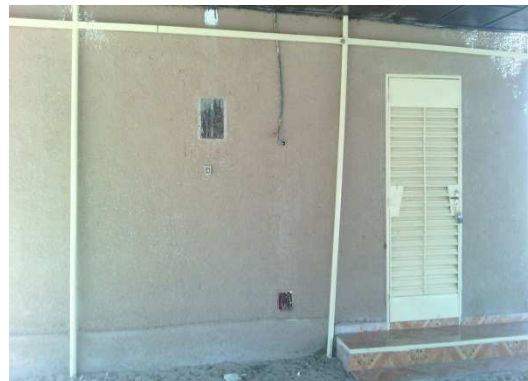
Case du Premier Ministre