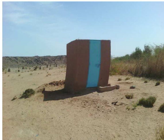
Blocs de sanitaire à deux compartiments