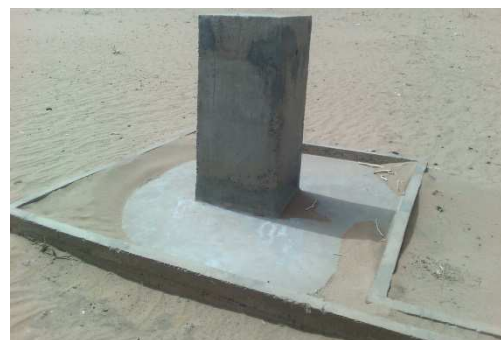
Borne fontaine Zounout