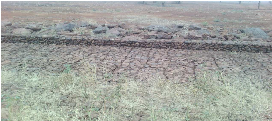
Seuil de zangon Roukouzoum (gabionnages et enrochement contre seuil)