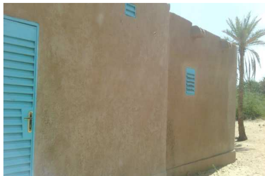
Case du Ministre d'élevage