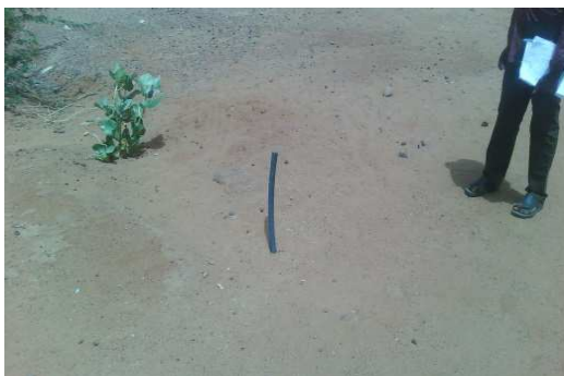
Branchement de l'Ecole INADOUGOUM