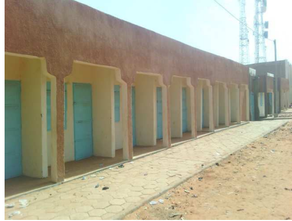
Devanture du marché moderne de Tahoua Boutiques extérieures de type BE1 3mx4m