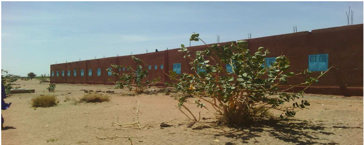
Vue de l'arrière des salles de classes