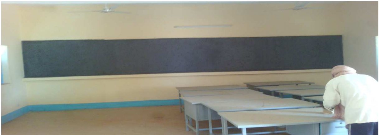
Intérieure d'une salle de classe