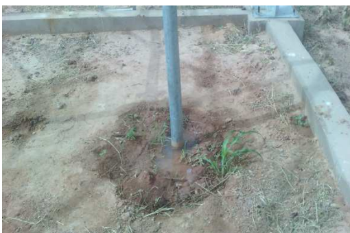
Fuite de conduite de distribution