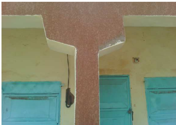
Mauvais coffrage, sous-dimensionnement du poteau