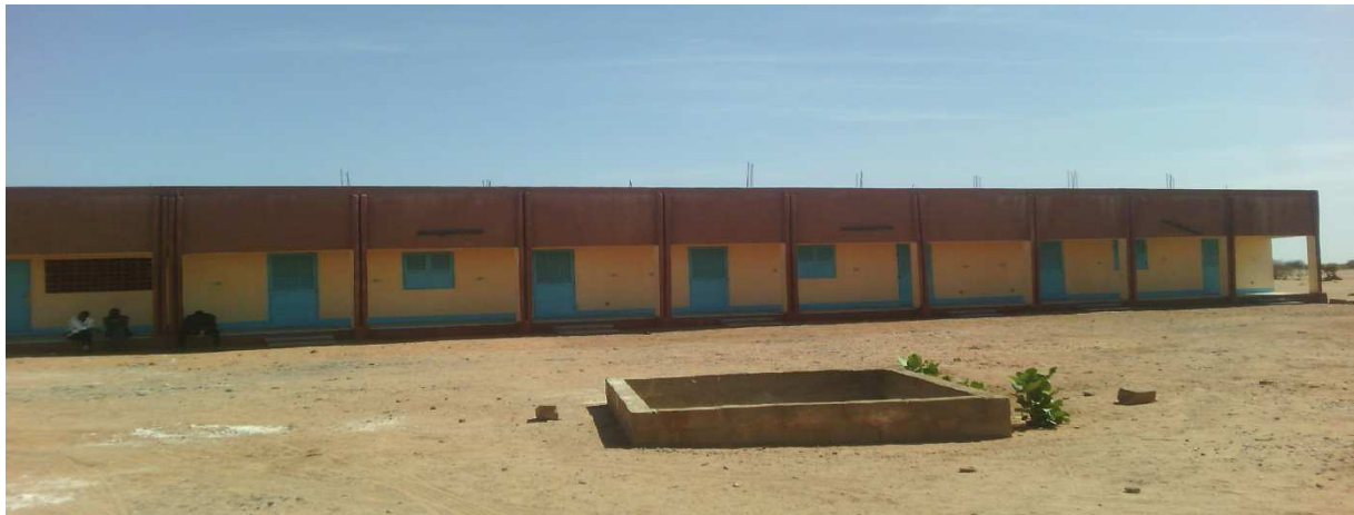
Blocs de 6 classes

L'état du chantier photographié se présente comme suit :