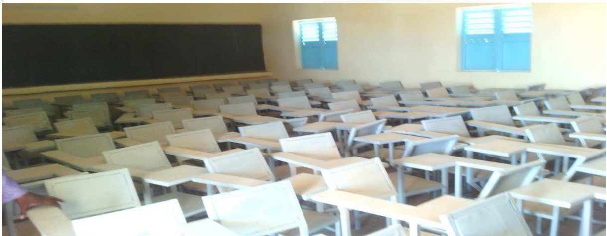
Intérieure d'une salle de classe