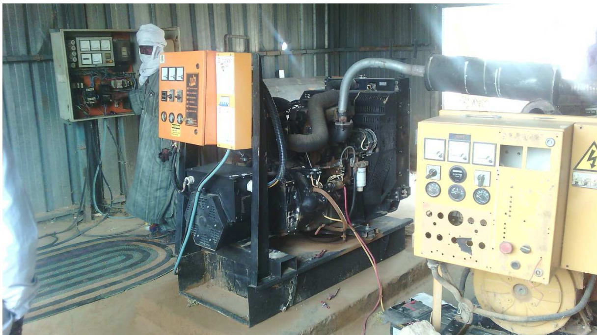
Groupe électrogène du village de TOUNFAMINIR

Voici l'état des groupes électrogènes photographié :