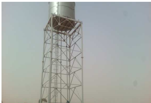
Réservoir de stockage de 25m 3

La photographie du chantier présentée comme suit :