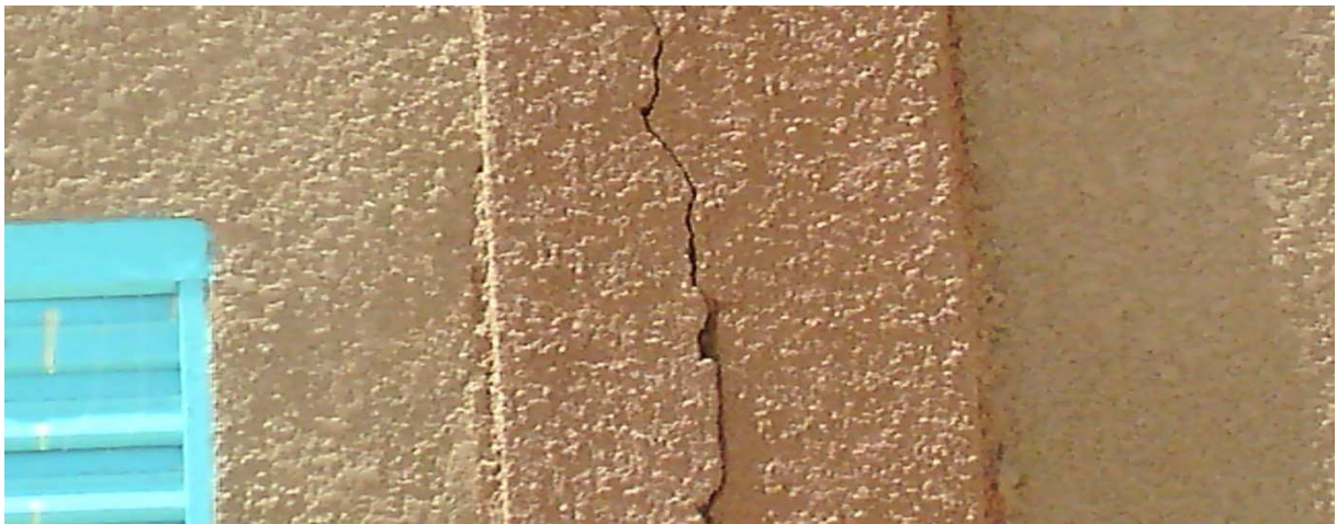
Joint de rupture de deux blocs de trois classes