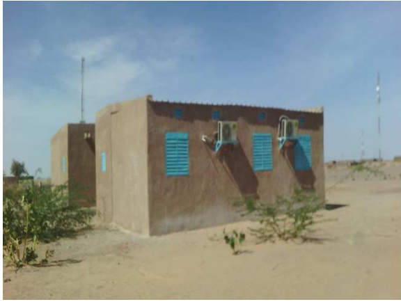
Case de Ministre d'élevage/Gouverneur