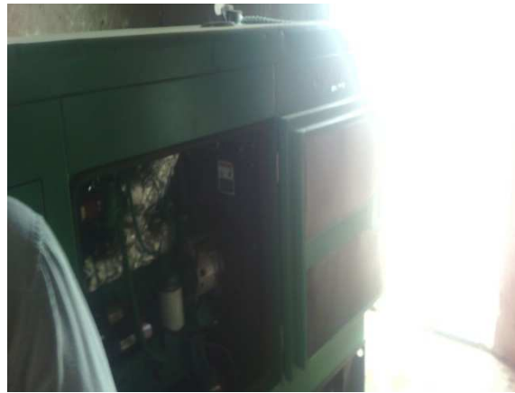
Groupe électrogène du village de TANATAHAMO