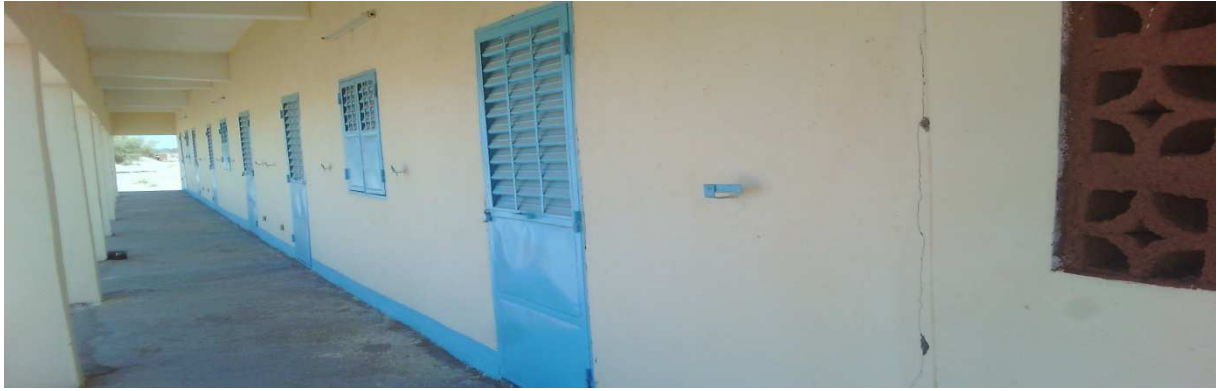
La menuiserie des blocs des classes