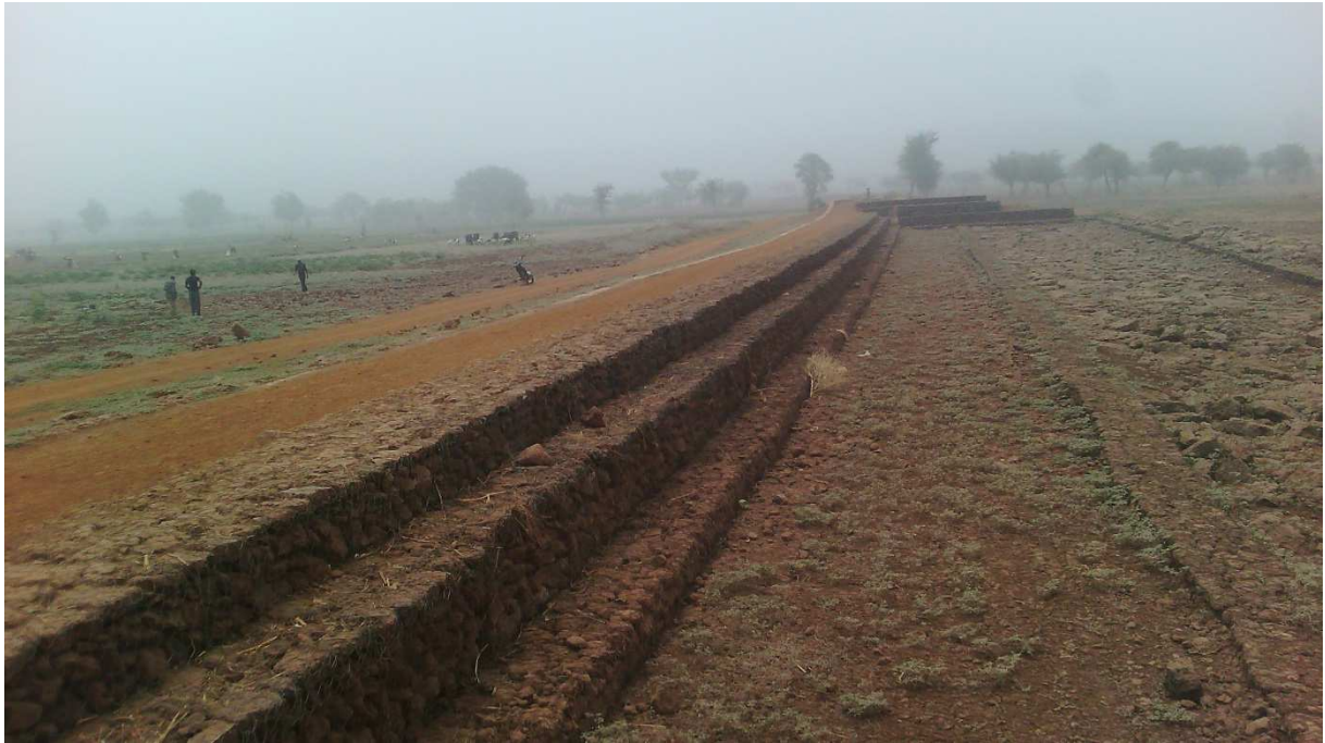
Seuil de seuil de Bourdi I (gabionnages et enrochement contre seuil)