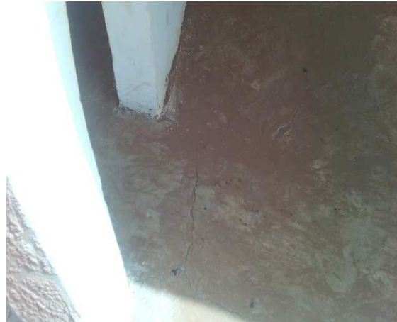
Fissurations du dallage