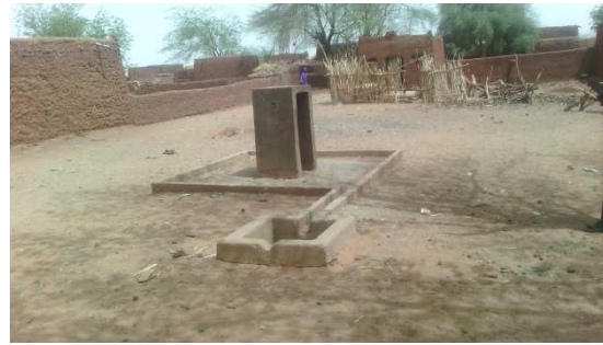
Borne fontaine1 INADOUGOUM