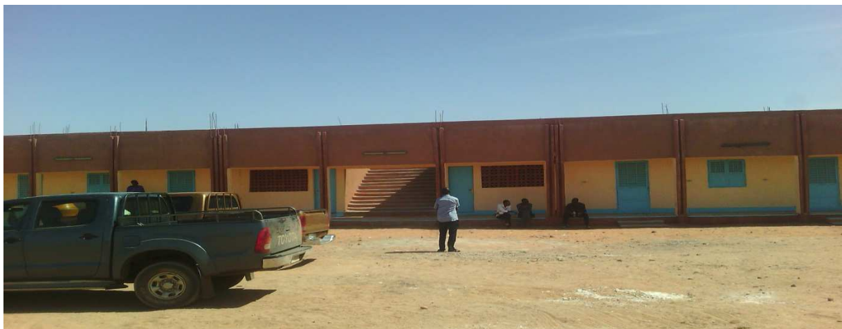
Vue d'ensemble (classes, sanitaire, escalier)