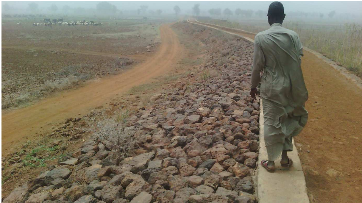
Seuil de seuil de Bourdi I (Enrochement contre seuil)