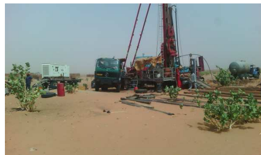
Le chantier du forage