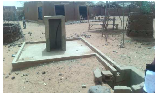
Borne fontaine3 INADOUGOUM