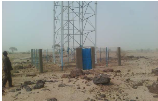
Clôture du réservoir