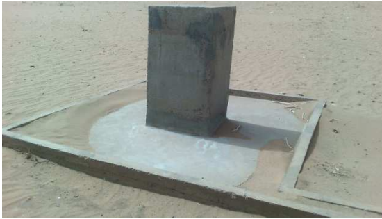
Bornes fontaines village Inkalafan