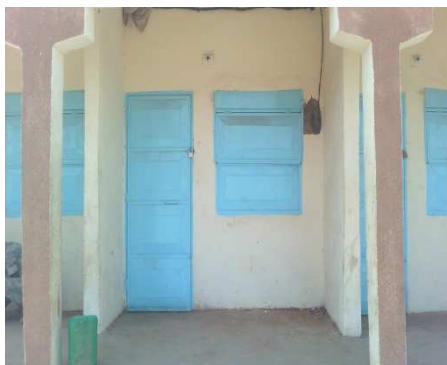
Une boutique type BE1 3mx4m