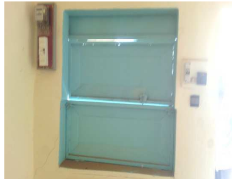
fenêtre de la boutique