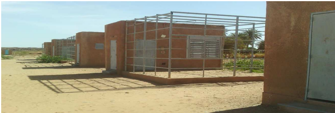
Case de passage