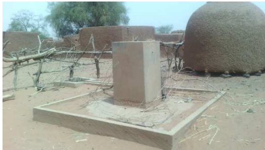
Borne fontaine2 INADOUGOUM