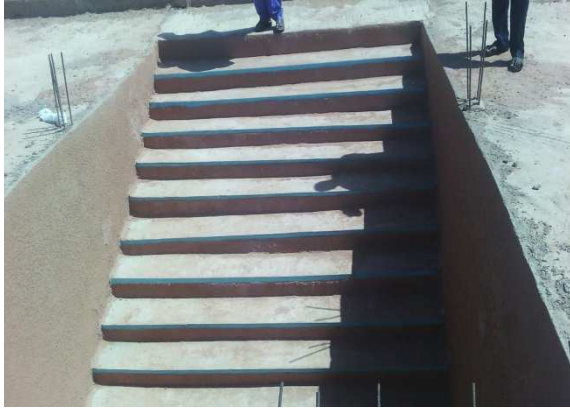
Escalier d'accès à la toiture