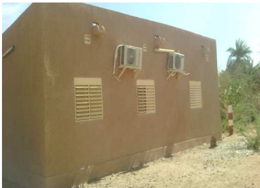
Case du premier Ministre

La photographie du chantier se présente comme suit :