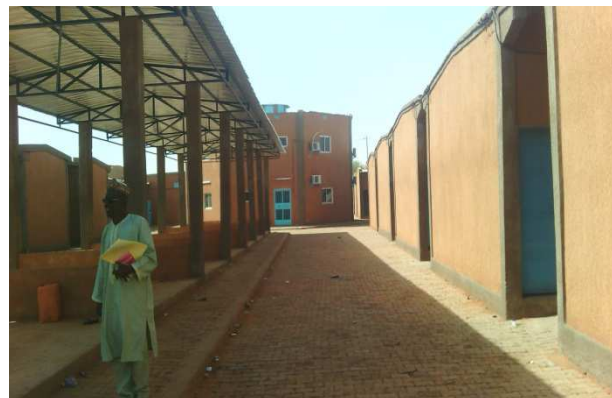
interieure du marché