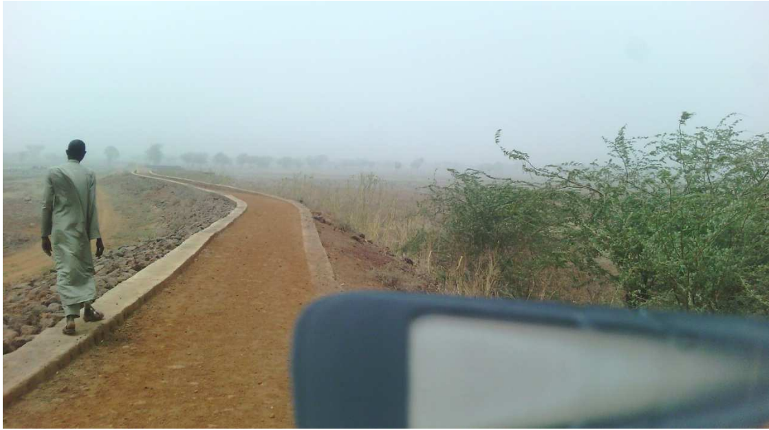
Seuil de seuil de Bourdi I